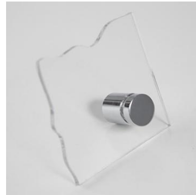
Fig. 4: Sistemul de prindere al plăcuțelor